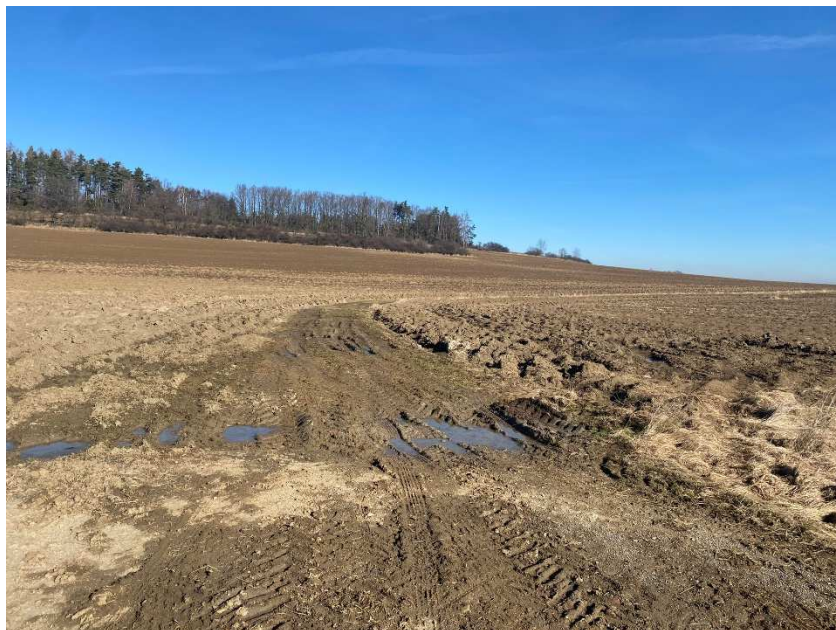
Trasa polní cesty NCV8 – konec