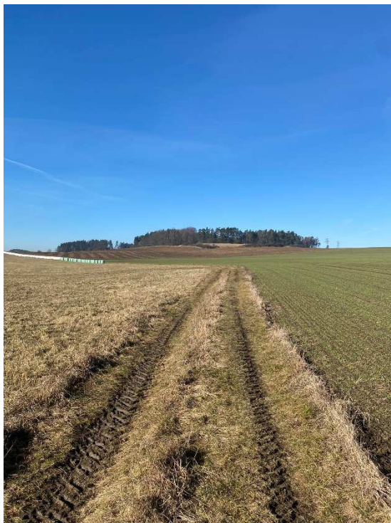
Trasa polní cesty NCV8 – začátek