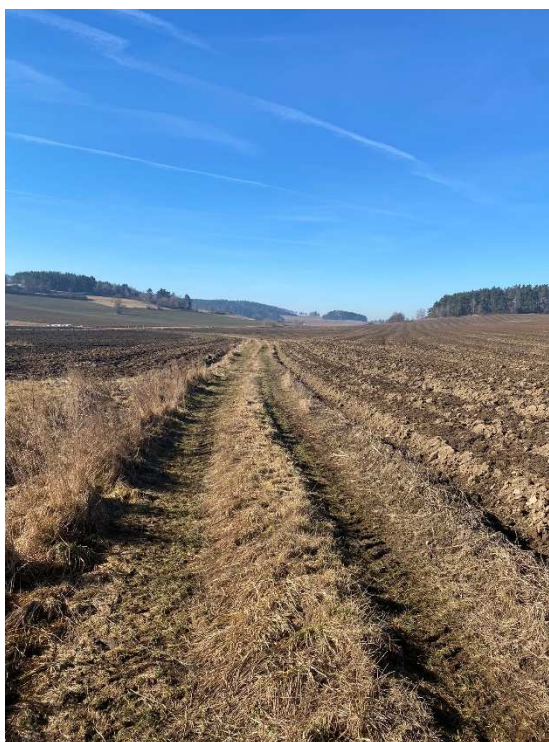
Trasa polní cesty NCV8 – trasa